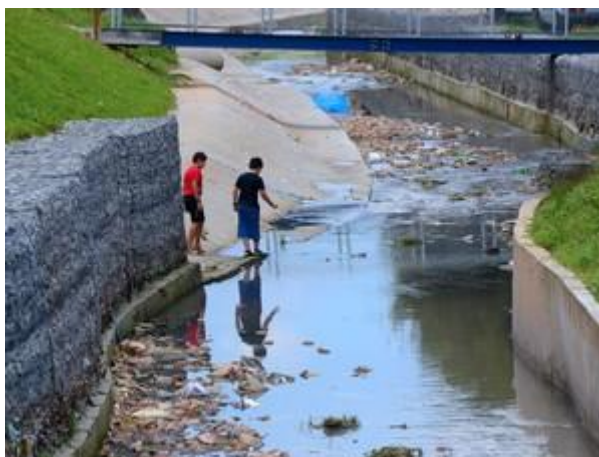
Imagem de 2011 mostra crianças da comunidade São Nicolau, em SP, em área de esgoto a céu aberto

De acordo com o decreto, após essa data, "a existência de plano de saneamento básico (...) será condição para o acesso a recursos orçamentários da União ou a recursos de financiamentos geridos ou administrados por órgão ou entidade da administração pública federal, quando destinados a serviços de saneamento básico".